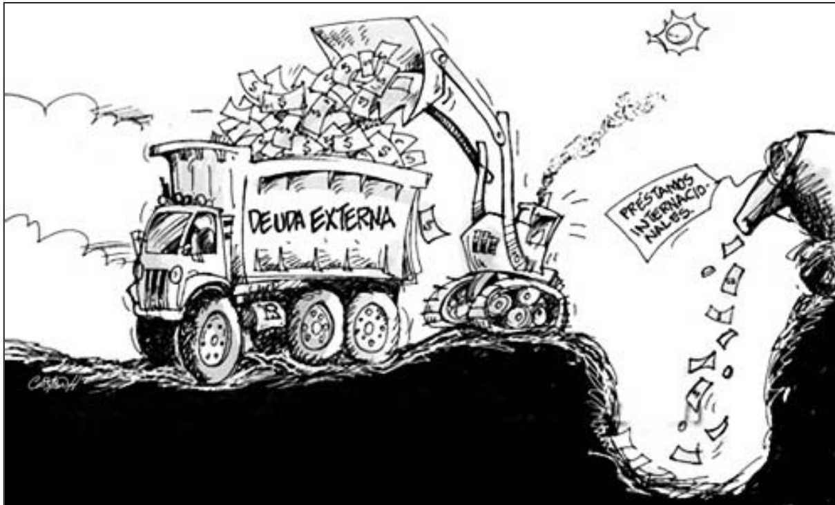
El gobierno de los Kirchner es el que más deuda externa pagó

Pero eso no es todo. En el último año el Ministro de Economía Axel Kicillof ha vuelto abiertamente a tomar nuevos créditos, ufánándose de haber obtenido 6.000 millones de dólares (a la tasa del 9% en dólares, la más alta del mundo). La consecuencia de todo esto es que sigue creciendo la bola de nieve de la deuda, con vencimientos crecientes en los próximos años.