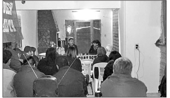
Presentación de candidatos en Río Gallegos

finalizando con un rico loco preparado por la militancia.