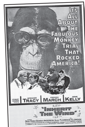
Afiche de 1960

El director de cine Stanley Kramer la llevó al cine, y su guionista fue uno los “autores prohibidos” de Hollywood. Se estrenó en 1960 y se