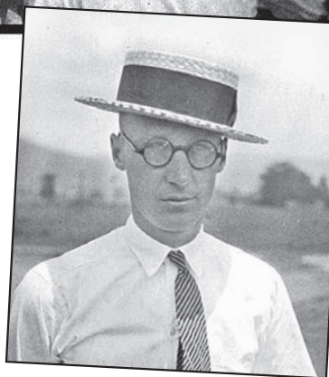
El profesor acusado Scopes

En los años '20 Estados Unidos se consolidaba como la primera potencia económica imperialista en el mundo capitalista posterior a la guerra mundial de 1914/18. Era una sociedad convulsionada por crecientes contrastes. Una gran burguesía cada vez más poderosa, sectores fervientemente religiosos y racistas, más que nada en las pequeñas ciudades y pueblos, y en el medio rural, convivían con las luchas y huelgas obreras y la arrolladora modernización que dinamizaba toda la sociedad, formando una amplia clase media. Se masificaban los electrodomésticos y los medios de comunicación, se desarrollaban la radio y el cine, se bailaba el charleston y el jazz conquistaba públicos. También se intensificaba la represión a los inmigrantes, en particular a los que querían sindicalizarse para pelear por sus derechos, y se impuso la prohibición del alcohol. Renació la organización asesina de negros el Ku Klux Klan, con mayor raigambre en el sur rural, religioso y racista.