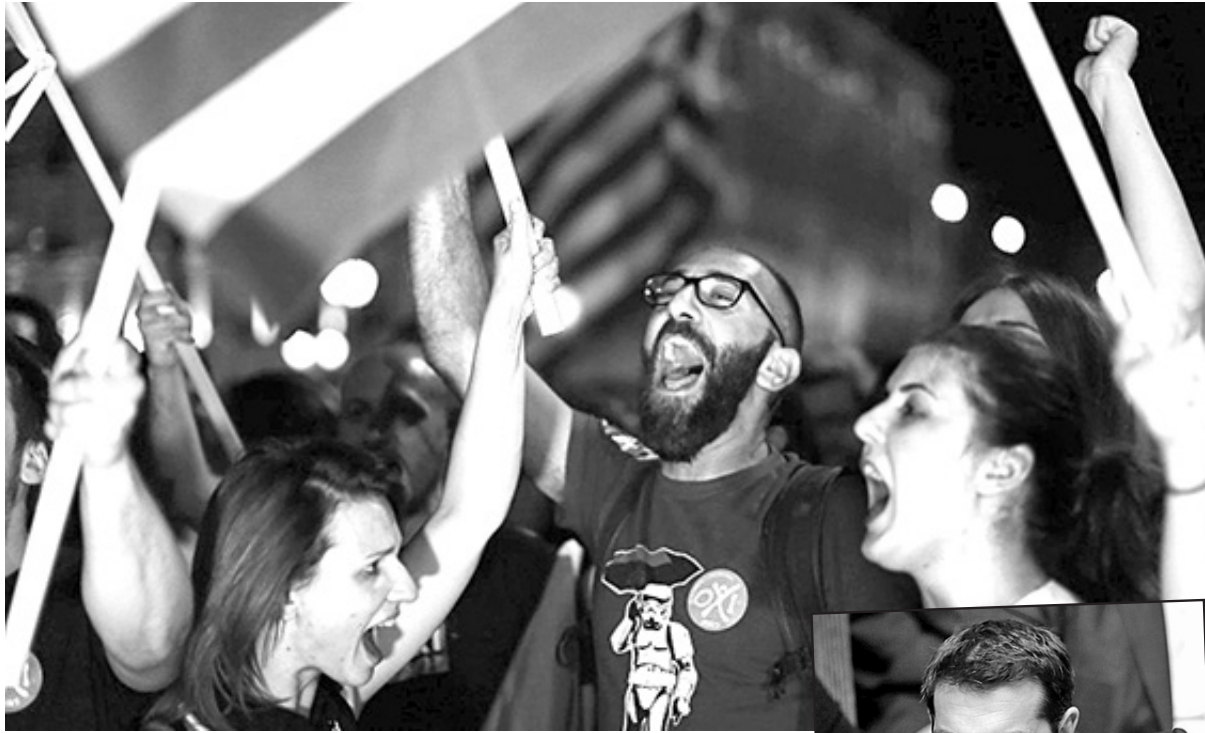
El pueblo dijo NO y Tsipras le dijo Sí a la Troika. Ya el lunes 20 pagó más de 4 mil millones de euros a la Troika. Y echó a los ministros de izquierda que rechazaron el acuerdo.

Tan grave ha sido el acuerdo con la Troika que un documento contra el mismo ya ha reunido la firma de 109 (de los 201) miembros del Comité Central de Syriza; es decir, una mayoría absoluta. El voto en el parlamento griego tuvo lugar al amanecer del 16 de julio: 229 votos SI, 64 votos NO. El acuerdo solo pudo ser aprobado gracias a los votos de los parlamentarios de la oposición patronal de Nueva Democracia, PASOK y de To Potami. El voto del grupo parlamentario de Syriza