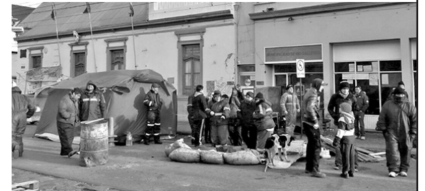
Trabajadoras y trabajadores municipales en lucha

Izquierda Socialista apoyó esta lucha, participando de movilizaciones y piquetes. Exigiendo que cumplan con el aumento otorgado en 2014 y que la provincia saque dinero de un fuerte impuesto a las empresas multinacionales que operan en Santa Cruz. Reclamando, además, a las centrales obreras (CGT-CTA) medidas urgentes en apoyo a los municipales. ¡Toda nuestra solidaridad para que los municipales triunfen!