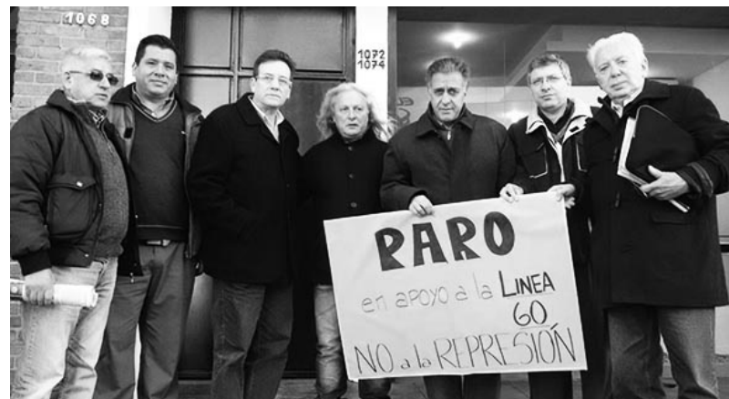
La lista Unidad antes de ingresar a la sede de la Confederación del Transporte llevando el reclamo de los compañeros de la Línea 60

Uno de los debates que se dio fue alrededor de quién se tiene que hacer cargo del sistema de transporte. Muchos sindicalistas plantearon que no necesariamente tiene que ser estatal, sino que tiene que haber unidad entre el "capital (empresario) y el trabajo". La delegación del FIT dejó claro la necesidad de estatizar todo el transporte como parte de un plan integral, bajo administración y gestión de sus trabajadores. El mayor contrapunto se dio alrededor del "modelo sindical".